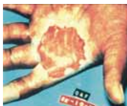
Schwere Hautschäden durch die Einwirkung radioaktiver Strahlung.

Seit dem Zusammenbruch des kommunistischen Systems in Osteuropa ist mit einer neuen Gefahrenquelle zu rechnen: Dem Handel mit radioaktiven Stoffen, insbesondere mit spaltbarem Plutonium. Viele Staaten der Welt sind zwar technologisch noch nicht in der Lage, selbst Kernwaffen herzustellen, da ihnen der erforderliche Spaltstoff fehlt. Dies ist nun durch den Schmuggel von Plutonium 239 aus den Oststaaten in den Bereich der Möglichkeit gekommen. Damit ergeben sich aber auch unter Umständen neue Aufgaben für die Feuerwehren.