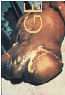
Beide Beine mussten amputiert werden, weil das Opfer zwei Strahlenquellen einsteckte.