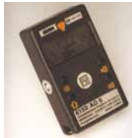
Das Standard- Dosisleistungsmessgerät in Österreich der Type AUTOMESS AD-6.

Vor allem bei Brandfällen in Radiosotopen-Labors ist mit dem Auftreten einer radioaktiven Brandrauch- bzw. Gaswolke zu rechnen.