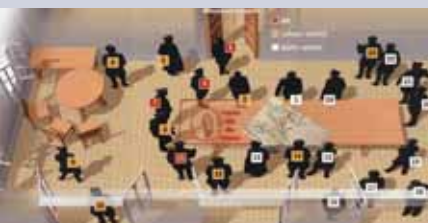
Beim Attentat vom 20. Juli 1944 überlebte Hitler (Person mit Nr. 1).

Ein historisches Beispiel dazu: Als Oberst Claus Graf Schenk von Stauffenberg das Attentat am 20. Juli 1944 auf Hitler verübte, befand sich der gesamte Führungsstab des Nazi-Regimes in einer Holzbaracke. Hier konnte sich die Druckwelle nicht so extrem auswirken (außerdem schirmte ein massiver Eichentisch die Sprengwirkung der in einer Aktentasche befindlichen Bombe erheblich ab) – Hitler überlebte. Wäre das Attentat – wie ursprünglich geplant – bereits am 15. Juli 1944 ausgeführt worden, hätte die Sprengwirkung ungleich größere Folgen haben müssen. Damals fand die Führer-Besprechung nämlich in der Wolfsschanze, dem verbunkerten Hauptquartier Hitlers statt. Aus diesem Betonunterstand hätte die Druckwelle nicht austreten können und mit Sicherheit alle Teilnehmer umgebracht. So spielte eine physikalische Tücke vielleicht Weltgeschichte!