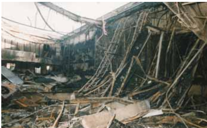
Totale Zerstörung der Welscher Volksbank durch einen Signalkörper.

schätzung der Gefahr kann über vorhandene Pläne, Auskünfte und Kennzeichnungen sicher nur unzureichend erfolgen. Es ergeben sich daraus aber bereits erste wichtige Hinweise. In einschlägigen Betrieben ist bei Einsätzen auf jeden Fall der Kontakt mit dem Sicherheits- bzw. Sprengstoffbeauftragten herzustellen. Anmerkung: Der Kontakt beim Einsatz sollte jedoch nicht der erste sein!