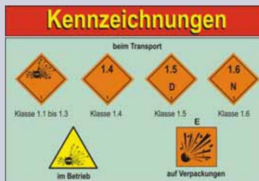
Kennzeichnungen von Explosivstoffen