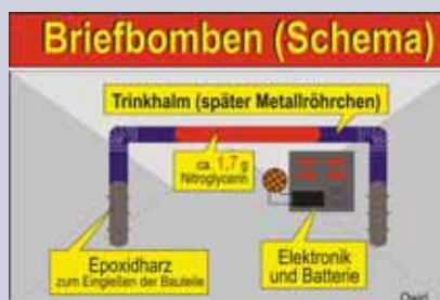
Die Briefbomben des Franz Fuchs (schematisch).

zweiten Welle ungleich größer: Dem damaligen Bürgermeister von Wien, Helmut Zilk, wurde dabei fast die ganze Hand weggerissen.