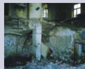
Schwere Bauschäden nach „Tresor-Explosion“ in Weitendorf (1984).

Im Jahre 1984 kam es in Weitendorf nahe Wildon in einem Steinbruch zu einem tragischen Explosionsereignis, welches zwei Todesopfer forderte. Bei einem Einbruch in das dort befindliche Verwaltungsgebäude schweißten die Gauner, in der Hoffnung, Geld zu ergattern, einen Tresor auf. Es erwartete sie jedoch nicht ein Bündel von Schillingscheinen, sondern eine geballte Ladung von über 100 Sprengkapseln. Diese waren im Tresor verwahrt worden. Die Wirkung war dramatisch, da durch den massiven metallischen Sicherheitsschrank eine starke Dämmwirkung gegeben war. Einer der beiden Einbrecher wurde dabei im wahrsten Sinn des Wortes in Stücke zerrissen, der zweite von einer einstürzenden Mauer erschlagen.