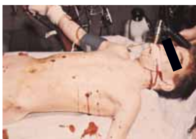
Splitterwirkung von Explosivstoffen.

Unsere Betrachtungen haben bereits gezeigt, dass massenexplosionsfähige Stoffe und Gegenstände besonders gefährlich sein können. Hier sind die Druckwirkungen dominant, es kommt aber parallel dazu auch zu Splitterwirkungen und zur Bildung von Spreng- und Wurfstücken. Auch eine Gefahr durch Feuer und giftige Explosionsgase (vor allem nitrose Gase!) ist gegeben.