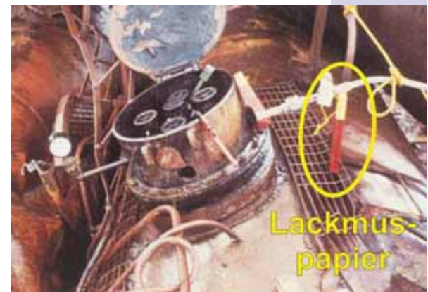
☛ Nachweis von Chlorgas mittels Lackmuspapier