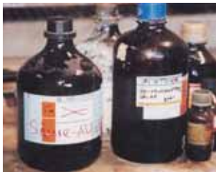
☛ Säurebehälter bei einer Abfallentsorgungsstelle.

man den prozentuellen Anteil eines Stoffes in einem Stoffgemisch. Bei Lösungen wird sie meist in Volums-Prozent angegeben.