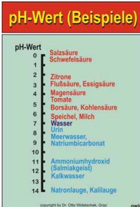
☛ Einige pH-Werte wichtiger Substanzen

Eine einfache (aber für viele meiner Leser wahrscheinlich unverständliche) Maßzahl zur Beschreibung des sauren oder basischen Charakters einer Lösung ist der so genannte pH-Wert (lat.: potentia Hydrogenii = Wirksamkeit des Wasserstoffs). Er wird als der negative, dekadische Lo-