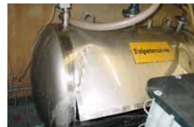
Durch eine chemische Reaktion wurde der Säuretank aufgeissen.

Werkstück, an welchen sichtbare Veränderungen feststellbar sind. Damit soll die Ätz- und Korrosionswirkung von gefährlichen Stoffen dieser Stoffgruppe verdeutlicht werden. Bei reizend wirkenden Stoffen wird gemäß Chemikaliengesetz und Unfallverhütungsvorschriften das bekannte Andreaskreuz als Piktogramm verwendet.