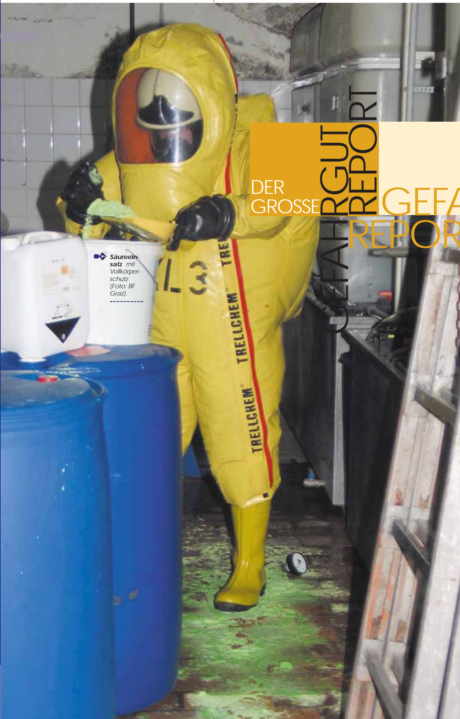
☛ Säureein- satz mit Vollkörper- schutz. -----